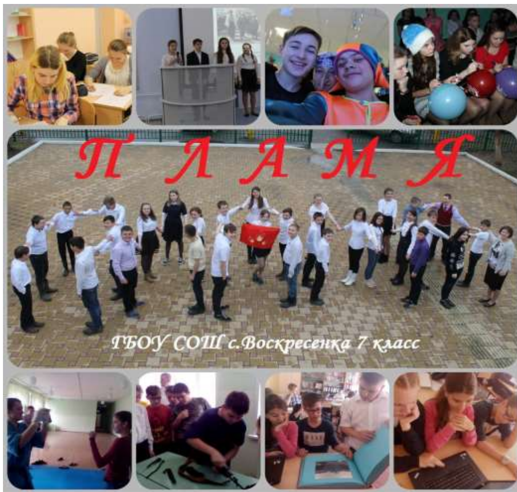
Фото-коллаж учащихся 7-го класса

Учащиеся 7 класса принимают участие в территориальном конкурсе ученического самоуправления «Классный Класс». Всего в конкурсе Принимает участие 27 классов Волжского района и г.о. Новокуйбышевск. В качестве первого задания учащимся было необходимо сделать имеджевое, необыкновенно креативное фото своего классного коллектива вместе с классным руководителем. Так же фотография должна была отражать название своего классного коллектива с которым класс готов отправится в дальнейший путь по школьной жизни и символы и атрибуты коллектива, которые станут отличительной чертой класса. По итогам первого задания учащиеся нашей школы заняли II место! Поздравляем их с победой и желаем удачи при выполнении следующих заданий! Ждем от Вас креативного выполнения всех заданий!