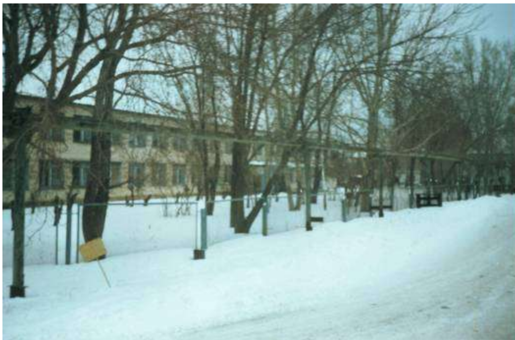
Современное здание школы

Школе исполнилось 145 лет, более 1000 выпускников закончили высшие учебные заведения из них: 10 лётчиков, 150 педагогов, 50 медработников, 10 работников банков, 12 юристов, 18 военных, 5 научных работников. Более половины педагогов школы – выпускники данного учреждения.