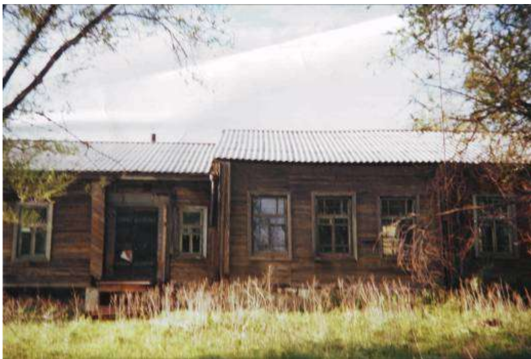
(фото: старое здание школы 1995 г.)

На плане, сделанном в 1892 году (см. Приложение) нарисован план училища (см. стр. 14 Приложения).