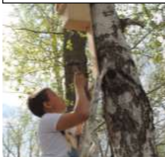
Размещение скворечников в рамках Акции «Сделаем Вместе»