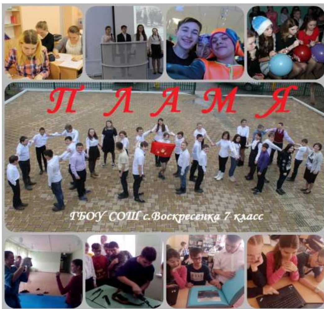
Фото-коллаж учащихся 7-го класса

Учащиеся 7 класса принимают участие в территориальном конкурсе ученического самоуправления «Классный Класс». Всего в конкурсе Принимает участие 27 классов Волжского района и г.о. Новокуйбышевск. В качестве первого задания учащимся было необходимо сделать имеджевое, необыкновенно креативное фото своего классного коллектива вместе с классным руководителем. Так же фотография должна была отражать название своего классного коллектива с которым класс готов отправится в дальнейший путь по школьной жизни и символы и атрибуты коллектива, которые станут отличительной чертой класса. По итогам первого задания учащиеся нашей школы заняли II место! Поздравляем их с победой и желаем удачи при выполнении следующих заданий! Ждем от Вас креативного выполнения всех заданий!