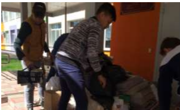
Сбор макулатуры в рамках Акции «Эко-Книга»

Цель этого решения — привлечь внимание к проблемным вопросам, существующим в экологической сфере, и улучшить состояние экологической безопасности страны.