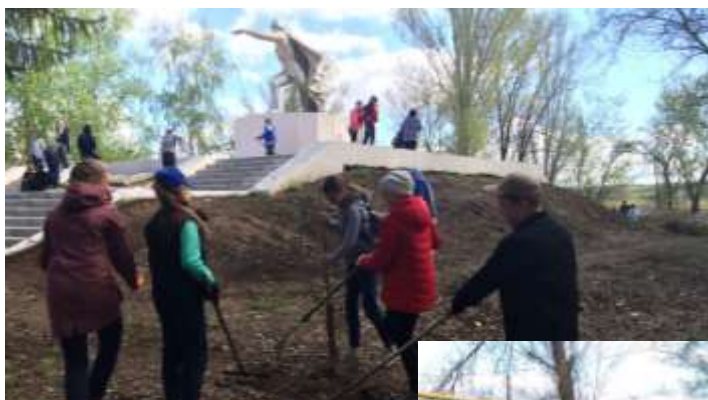
Уборка парковой зоны в рамках экологического субботника «Мы помним!»

у памятника Погибшему солдату прошел экологический субботник «Мы помним» , где учащиеся провели уборку памятника и прилегающую к нему территорию.