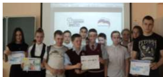
Единый Экологический урок "Свобода от отходов"