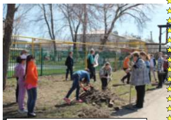
6-ой класс: уборка территории