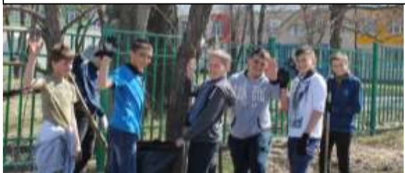
Экологический субботник «Сделаем вместе». Учащиеся 7-го класса