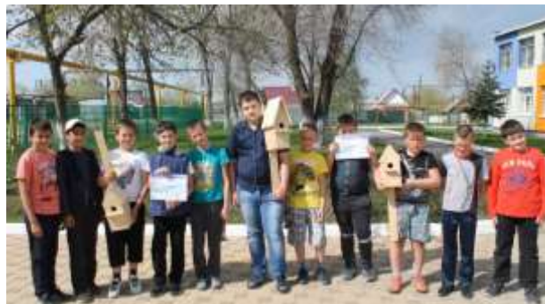
Акция «Сделаем вместе». Учащиеся 5-8 классов

5 мая прошел «Экологический субботник «Зеленая весна» . Учащиеся высадили на территории школы саженцы берез, убрали газоны и побелили деревья.