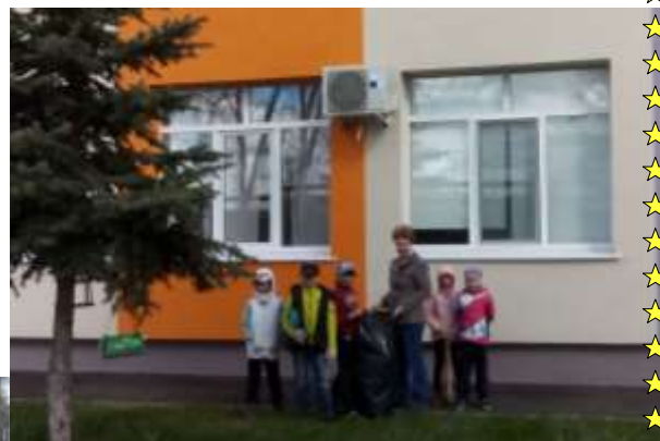
Экологический субботник «Сделаем вместе». 3-ий класс на уборке территории