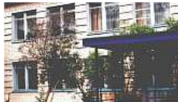
МОУ Воскресенская СОШ в настоящее время

Село делилось на две группы: раскольники, которых в селе больше трети и православные. Раскольникам или староверам не нравилось обучение в училище – «звуковой метод, басенки, песенки и прочее», они хотели, чтобы обращали внимание на религиозно-нравственное чтение и на славянский язык. Со временем стало больше преподаваться Божье Слово, и дети раскольников тоже стали посещать школу. Год от года, училище завоевывает все больше и больше симпатий общества.